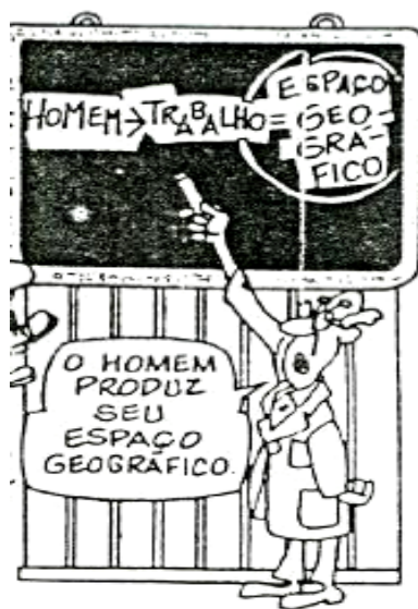
KOSEL, Salete; FILIZOLA Roberto. O espaço vivido . São Paulo: FTD, 2001, p 13.

A figura ilustra uma situação hipotética de ensino-aprendizagem da Geografia Escolar sob a influência do (da):